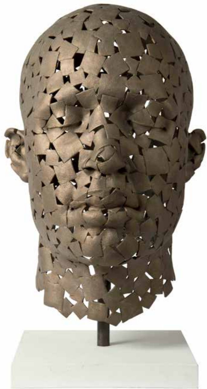
COCII Cuadros 63 x 40 x 43 cm