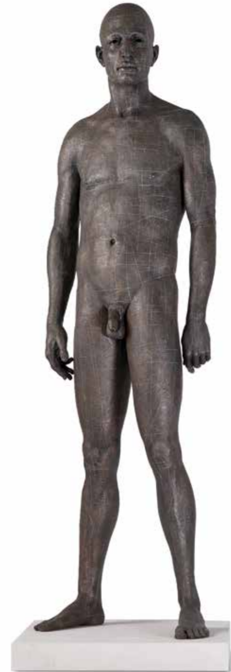
Personaje H 1:1 183 x 51 x 35 cm