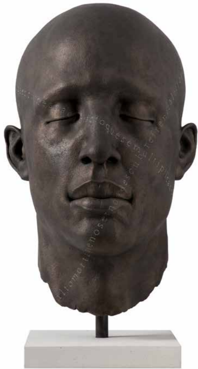
COCIII Texto Cruzado 63,5 x 39 x 46 cm