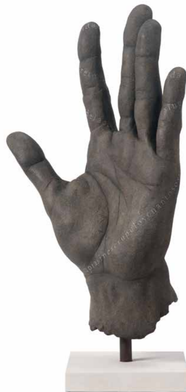
Mano IX 68,5 x 41,5 x 18,5 cm