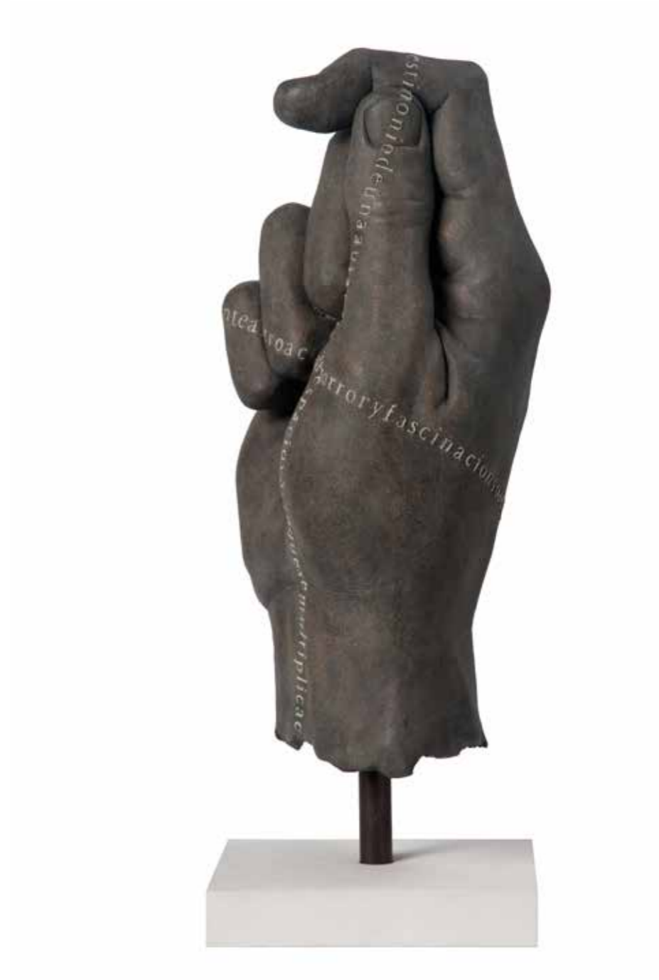
Mano X 55 x 29 x 24 cm