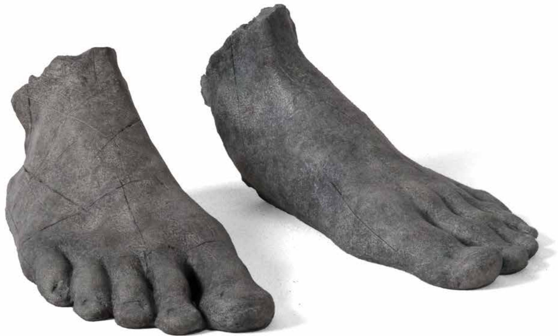
Pies H. 1:1 9,5 x 18,5 x 21 cm