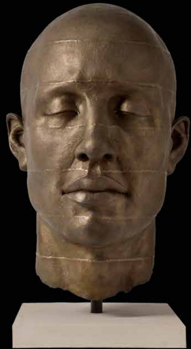
COCI Lineas de Soldadura 64 x 42 x 45,5