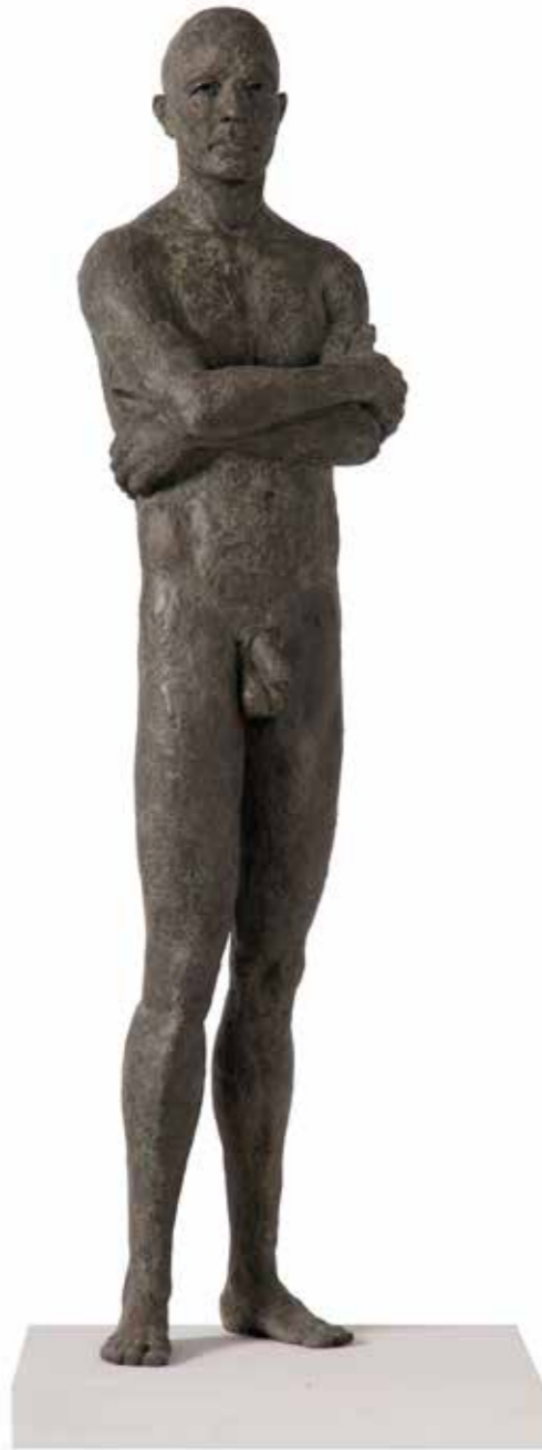
Inmigrante V 93 x 23 x 17 cm