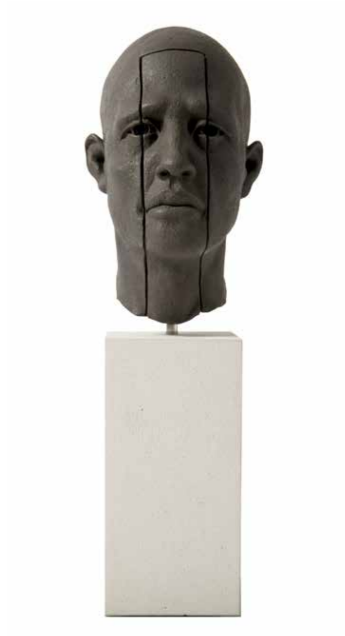
Cabeza Cuña 22 x 14 x 16 cm