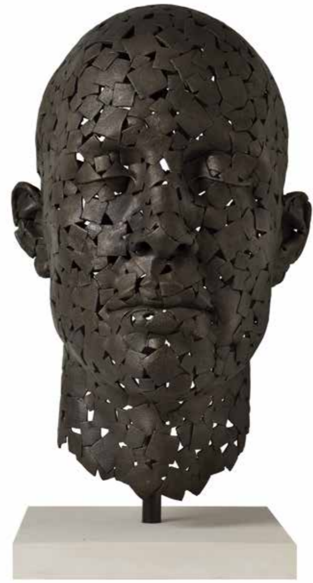
COCI Cuadros 66 x 42 x 45,5 cm