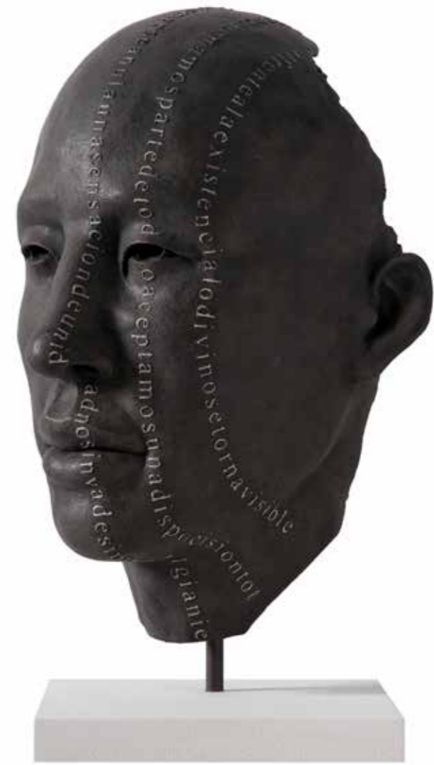
Rostro Texto Vertical 57 x 37 x 32 cm