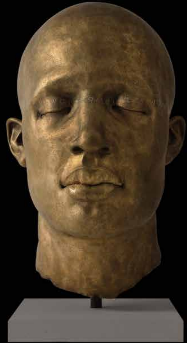
COII Poema 63 x 40 x 43 cm