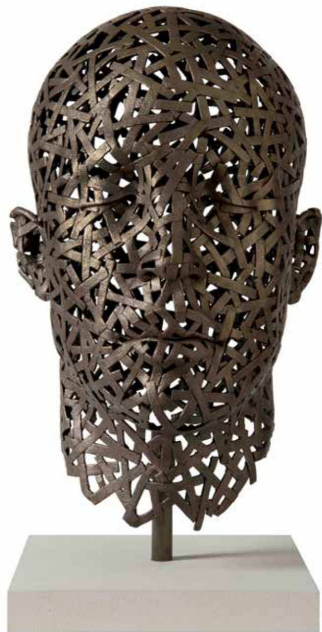
COCIII Trama 62 x 39 x 44 cm