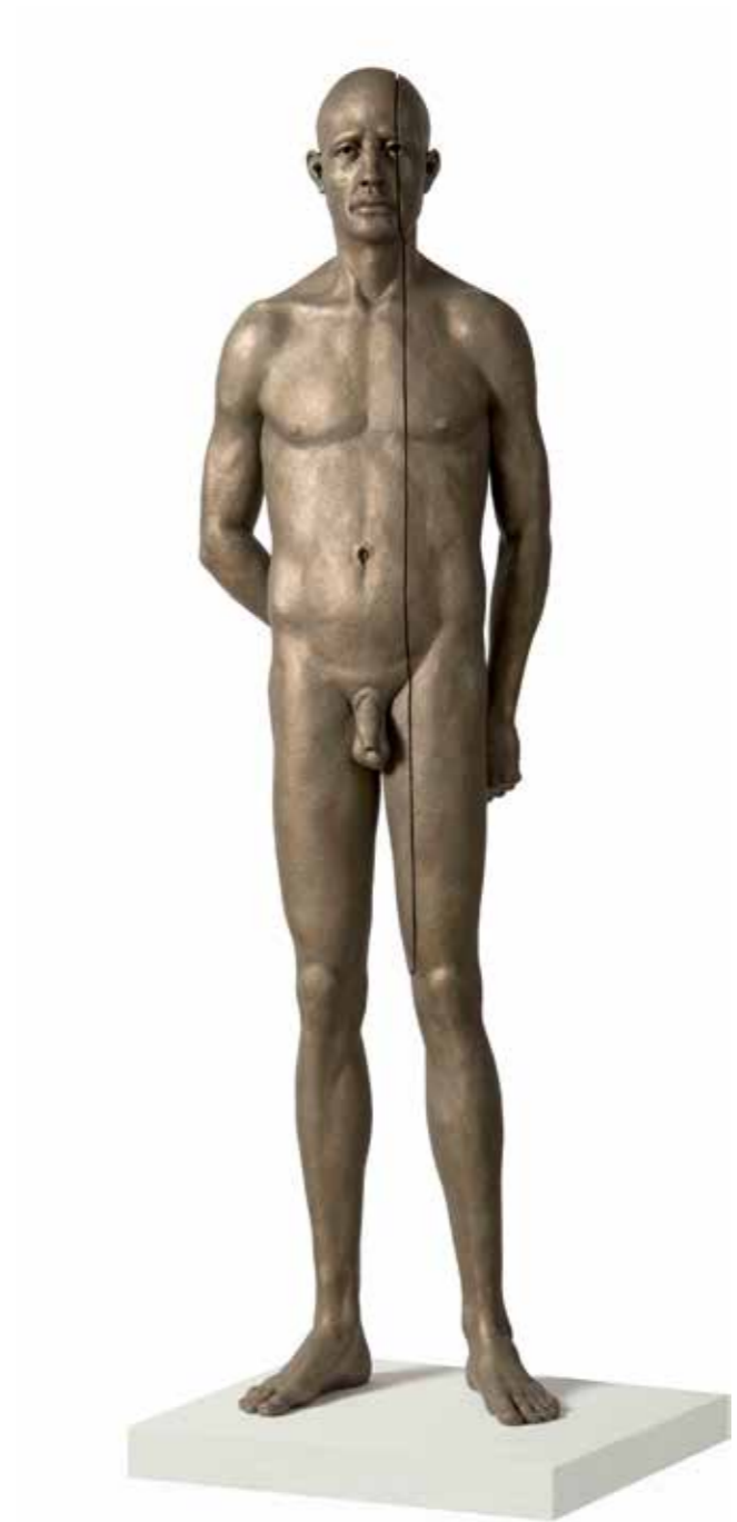
Hombre Linea 140 x 40 x 31 cm