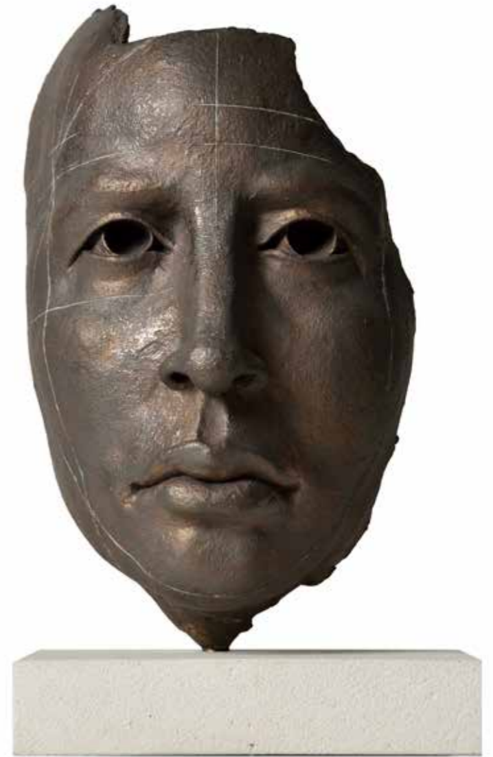
Fragmento Poema II 22,5 x 13,5 x 9 cm