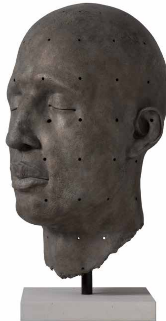
COCIII Huecos 63,5 x 39 x 46 cm